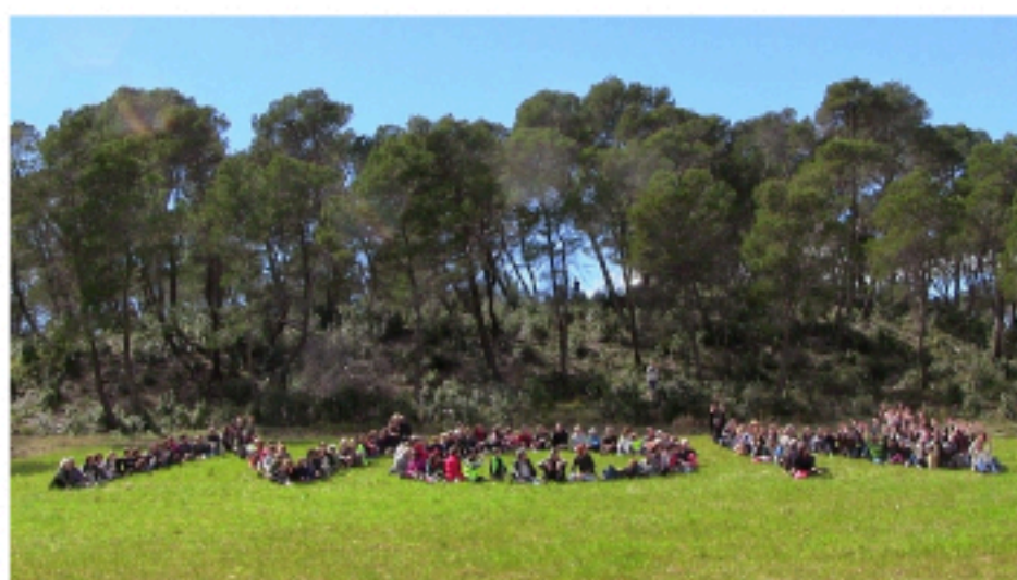
Mobilisation contre le projet de centre commercial "Oxylane"

Les actions déjà menées par "vivons montferrier" sont la garantie de la force et de la sincérité de nos propositions et de notre capacité à agir.