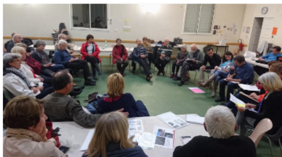
Atelier de démocratie locale animé par "vivons montferrier"

Parce que "vivons montferrier" est un mouvement citoyen inféodé à aucun parti politique .