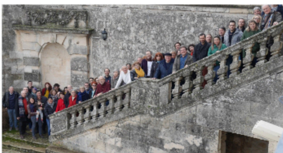
"vivons montferrier", un collectif de citoyens actif depuis 2013

Pour "vivons montferrier", l'éthique, la transparence, la responsabilité et le sens de l'intérêt général ne sont pas que des mots.